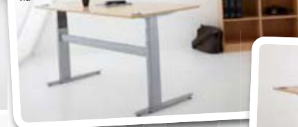
501-29 Model z dodatkowym trybem oraz wyższą maksymalną wysokością. Posiada dodatkowe cechy, w tym blokadę bezpieczeństwa oraz wbudowane korytko na kable.

Biurka przeciwdziałają kurczeniu się kręgosłupa Ergonomiczne stanowiska pracy