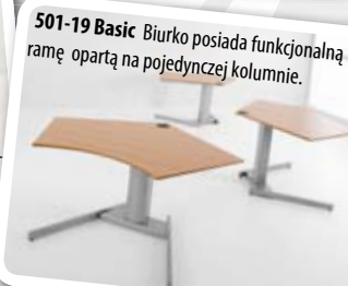
501-19 Basic Biurko posiada funkcjonalną ramę opartą na pojedynczej kolumnie.