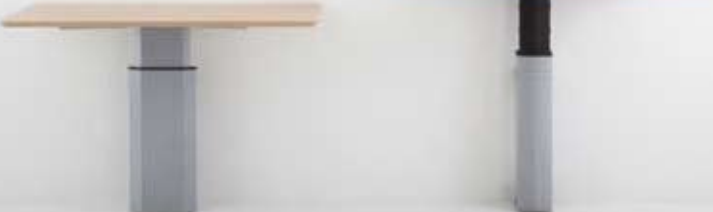
501-19 Wall Biurko zapewnia dużo miejsca na nogi i przy tym jest stylowe oraz nowoczesne. Jest to funkcjonalne oraz atrakcyjne stanowisko pracy.