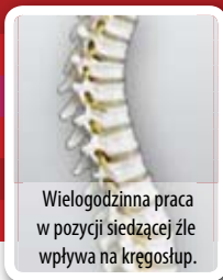
Wielogodzinna praca w pozycji siedzącej źle wpływa na kręgosłup.