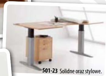
501-23 Solidne oraz stylowe.