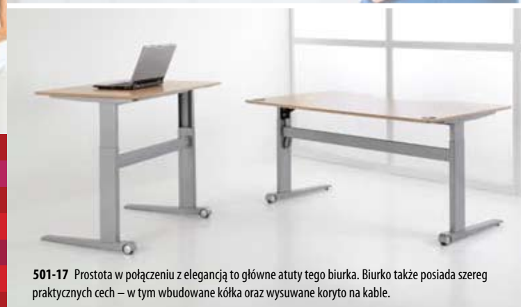
501-17 Prostota w połączeniu z elegancją to główne atuty tego biurka. Biurko także posiada szereg praktycznych cech – w tym wbudowane kółka oraz wysuwane korytko na kable.

Ergonomia oraz elastyczność to najważniejsze elementy stanowiska pracy. Możliwość zmiany pozycji z siedzącej na stojącą to bardzo ważny element idealnego stanowiska. Biurka produkowane przez firmę ConSet mają przystępne ceny, a wiele z nich jest dostępnych w szerokiej gamie kolorów oraz rozmiarów. Korzyści płynące z możliwości zmiany pozycji pracy z siedzącej na stojącą są odczuwalne niemal natychmiastowo. Zatem nie siedź beczynnio: zadbaj o siebie oraz własne zdrowie!