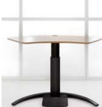
501-19 Design Unikatowy projekt umożliwiający ciekawą kompozycję w biurze.